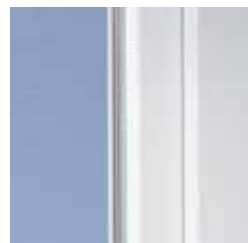
Klassiek design met afgeronde kanten

Ze zijn een aanwinst voor elk huis: ramen met moderne kunststof profielen van VEKA. Want het klassieke design met de licht afgeronde kanten van het SOFTLINE profiel-systeem is tijdloos. Daardoor is het perfect te combineren met de meest uiteenlopende bouwstijlen – van traditioneel tot modern. Ideaal voor zowel renovatie als nieuwbouw.