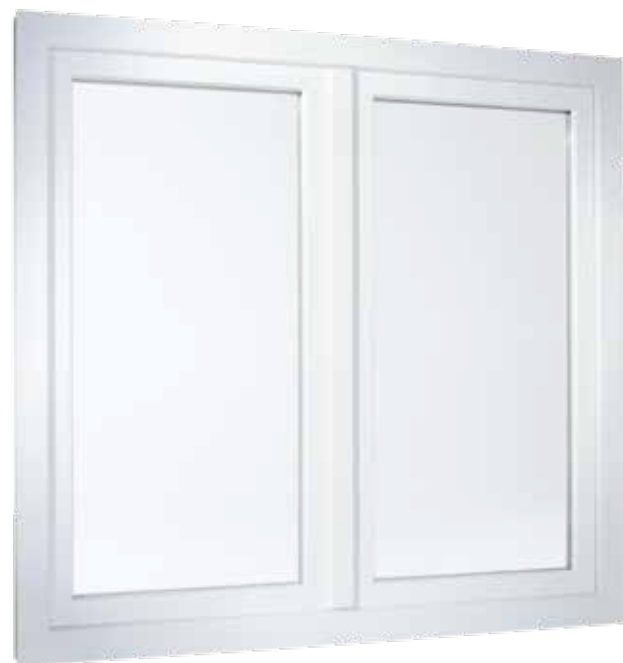
Ramen met dubbele vleugels in verspringende uitvoering

Het is overigens niet alleen het uiterlijk van SOFTLINE 70 dat indruk maakt. De techniek binnenin is al even overtuigend. De meerkamerprofielen maken optimaal gebruik van de isolerende eigenschap van lucht, waardoor ze voldoen aan de hoogste eisen ten aanzien van warmte-isolatie. Dat zorgt niet alleen voor een aangenaam binnenklimaat bij elk weertype, maar draagt in de winter ook bij aan een merkbare verlaging van de stookkosten.